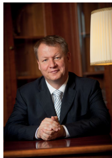
Svatopluk Němeček ministr zdravotnictví ČR

MINISTERSTVO ZDRAVOTNICTVÍ ČESKÉ REPUBLIKY